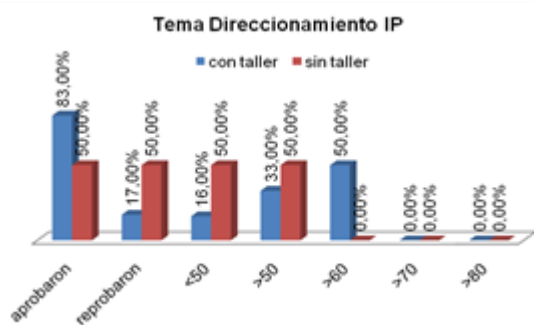
Figura 1. Evaluación de concepto

Del análisis realizado se puede observar en el gráfico (ver Figura 1) que el 50% de los estudiantes que no realizaron el taller obtuvieron notas menores a 50 puntos. Además, se puede advertir, que los estudiantes que sí realizaron el taller, aprobaron con mejores notas, lo que se traduce en respuestas mucho más acabadas y precisas del concepto evaluado.