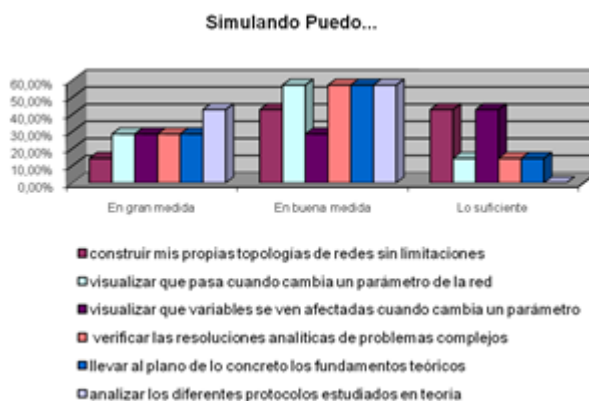
Figura 2. Cuestionario actitudinal

Del análisis del estudio actitudinal (ver Figura 2 y Figura 3) sobre la asignatura y temática estudiada, se evidenció que en general los estudiantes consideraron la facilidad de cambiar la topología propuesta, de llevar al plano de lo concreto los fundamentos estudiados, la facilidad de cambiar parámetros y observar el comportamiento, poder verificar resoluciones de problemas complejos.