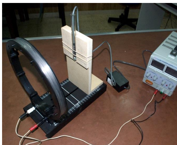
Figura 2. Diseño para medición de intensidad de campo magnético producido por una corriente que circula en una bobina, a lo largo del eje.

En el eje de la bobina se ubica la mancha blanca del detector sujeto a un sistema mecánico que permite variar la distancia a la bobina. Se acopla el detector a una interfaz y ésta a una computadora con el programa de procesamiento de datos. En la figura 2 se muestra el correspondiente diseño ingenieril para el desarrollo de la experiencia.