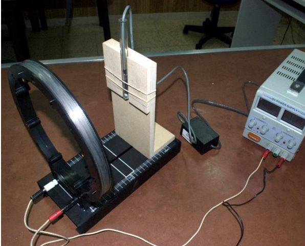
Figura 2. Diseño para medición de intensidad de campo magnético producido por una corriente que circula en una bobina, a lo largo del eje.