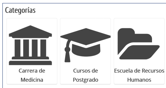
Figura 2. Accesos a las categorías principales del entorno educativo.

Información de los cursos: Se estandarizó la forma en la que se muestran los nombres de los cursos, indicando el nombre de la materia y el año lectivo. En la descripción, que también tiene un formato homogéneo para todos los cursos, se muestra el nombre del titular de la cátedra o del director del curso de postgrado, una breve descripción del curso, el año lectivo, y un enlace que lleva al espacio que cada cátedra dispone en el sitio web de la Facultad, en el que aparece la nómina de los docentes y la información de cada cátedra. (Figura 4)