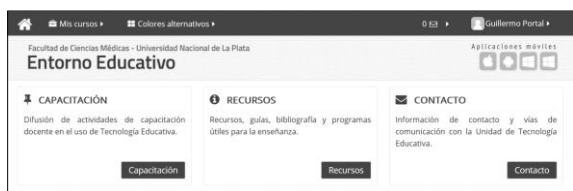
Figura 1. Vista de la parte superior de la página principal del entorno educativo, donde fueron ubicados tres cuadros de texto con enlaces a sendas secciones de información.

Secciones de información: (Figura 1) En la parte superior de la página principal fueron ubicados tres cuadros de texto con enlaces a sendas secciones de información: el cuadro de la izquierda se asignó a una sección con información sobre actividades de capacitación en Tecnología Educativa organizadas por la Unidad de Tecnología Educativa de la Facultad. El recuadro de la parte central enlaza a una sección con información sobre recursos, manuales, libros, guías y sitios web que cubren temas relacionados con el uso de Tecnología en la enseñanza: EVEAs, software de presentaciones, sitios de fotografía de stock, etc. Finalmente, en la parte derecha se ubicaron las direcciones de correo electrónico para consultas técnicas sobre el entorno educativo y para la Unidad de Tecnología Educativa.