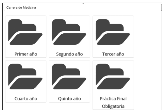
Figura 3. Acceso a los años del plan de estudio, según la organización de la carrera de Medicina.

Roles personalizados: Se crearon roles propios que se adaptan a las necesidades que se relevaron, tales como tener un rol para el secretario y otro para el docente coordinador. Además hay roles generales asociados por capacidad de edición dentro de un curso, tal como el docente con, o sin, posibilidad de edición. En la solicitud de curso, cada profesor titular especifica quién será el Docente coordinador del curso, a quien se otorgan permisos de edición y de matriculación de docentes y alumnos. El rol de Secretario incluye los permisos de edición y de matriculación de alumnos. Existen además los roles de Docente con y sin permiso de edición ; ninguno de estos roles tiene permisos de matriculación de participantes. Finalmente, el rol de Estudiante permite ver, descargar e interactuar con los distintos recursos y actividades, sin permisos de edición ni de matriculación de participantes. En la Figura 5 están representados los roles del entorno con sus correspondientes permisos.