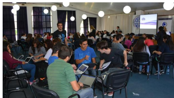
Figura 3. Estudiantes en plena competencia.

colaborativamente en uno de los torneos realizados, en dependencias de la FAIF.