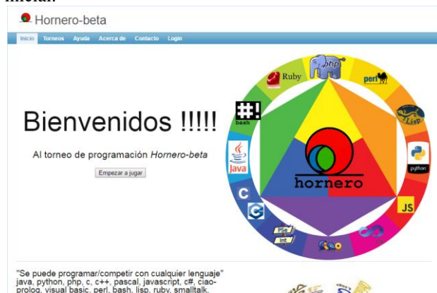
Figura 2. Pantalla Inicial de la aplicación HORNERO.

personas interesadas. La figura 2 muestra la pantalla inicial.