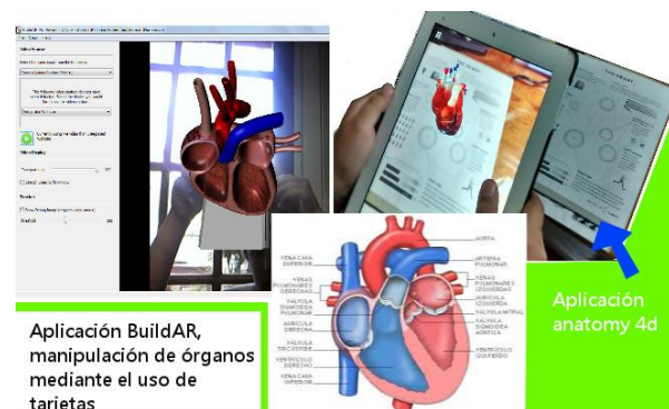
Figura 2. Funcionamiento del corazón: imagen 2D versus recursos RA

La figura 2 muestra las interfaces de las aplicaciones BuildAR y Anatomy donde se observa el trabajo con el corazón. En la primera el alumno al girar la tarjeta puede ver la parte interna y externa del corazón. En la segunda, puede visualizar la parte externa e interna, en detalle cada una de las venas, el flujo sanguíneo, ver los movimientos del corazón y escuchar los latidos, entre otras posibilidades.